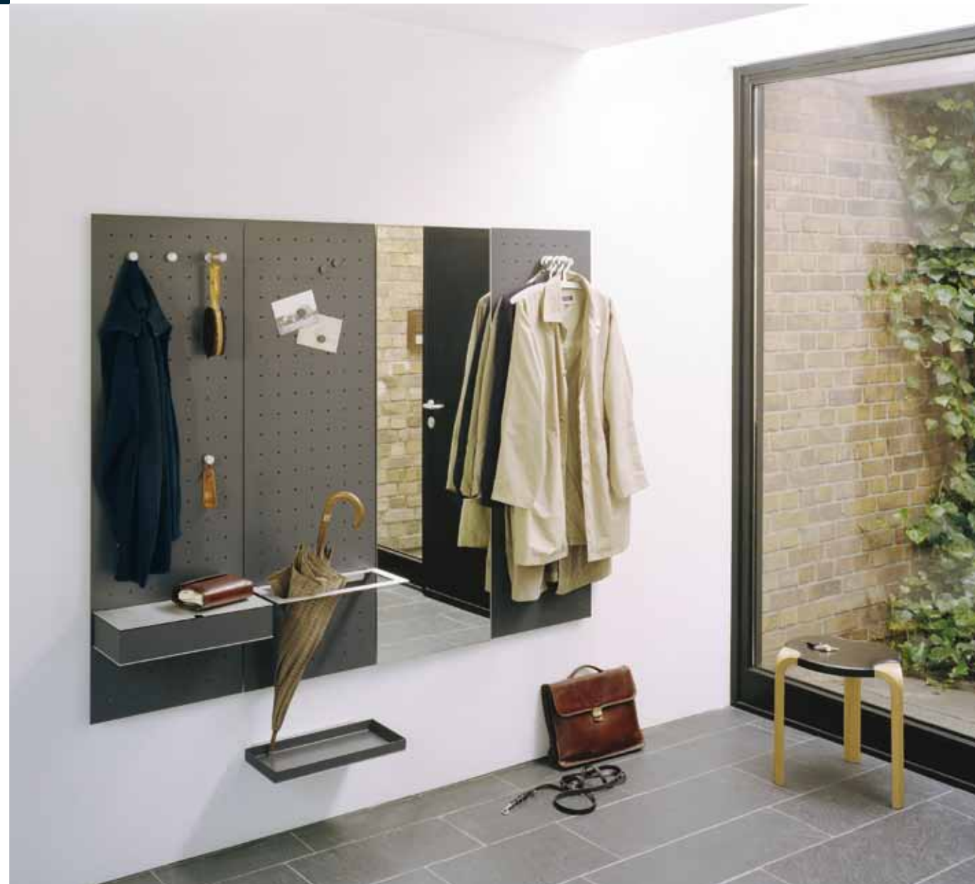
030 Paneele Graphitgrau, Ablagen und Haken Alu natur Panels graphite grey, shelves and hooks aluminium natural anodised