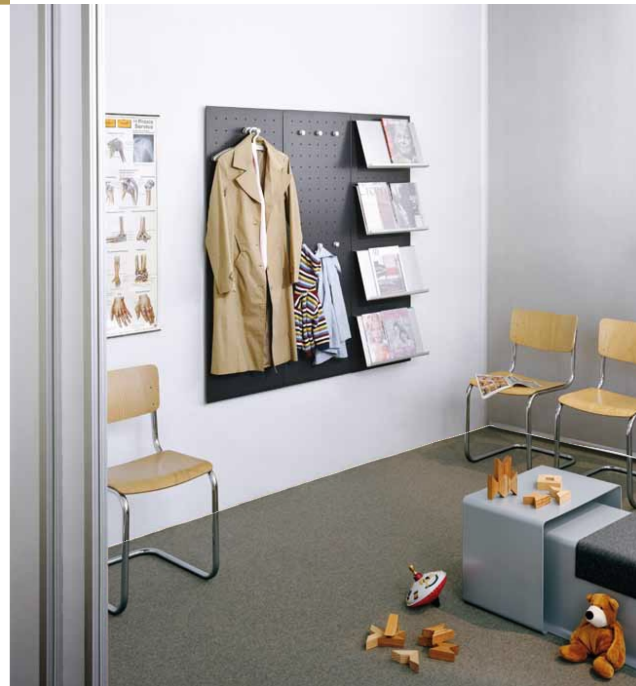
030 Paneele Graphitgrau, Ablagen und Haken Alu natur Panels graphite grey, shelves and hooks aluminium natural anodised