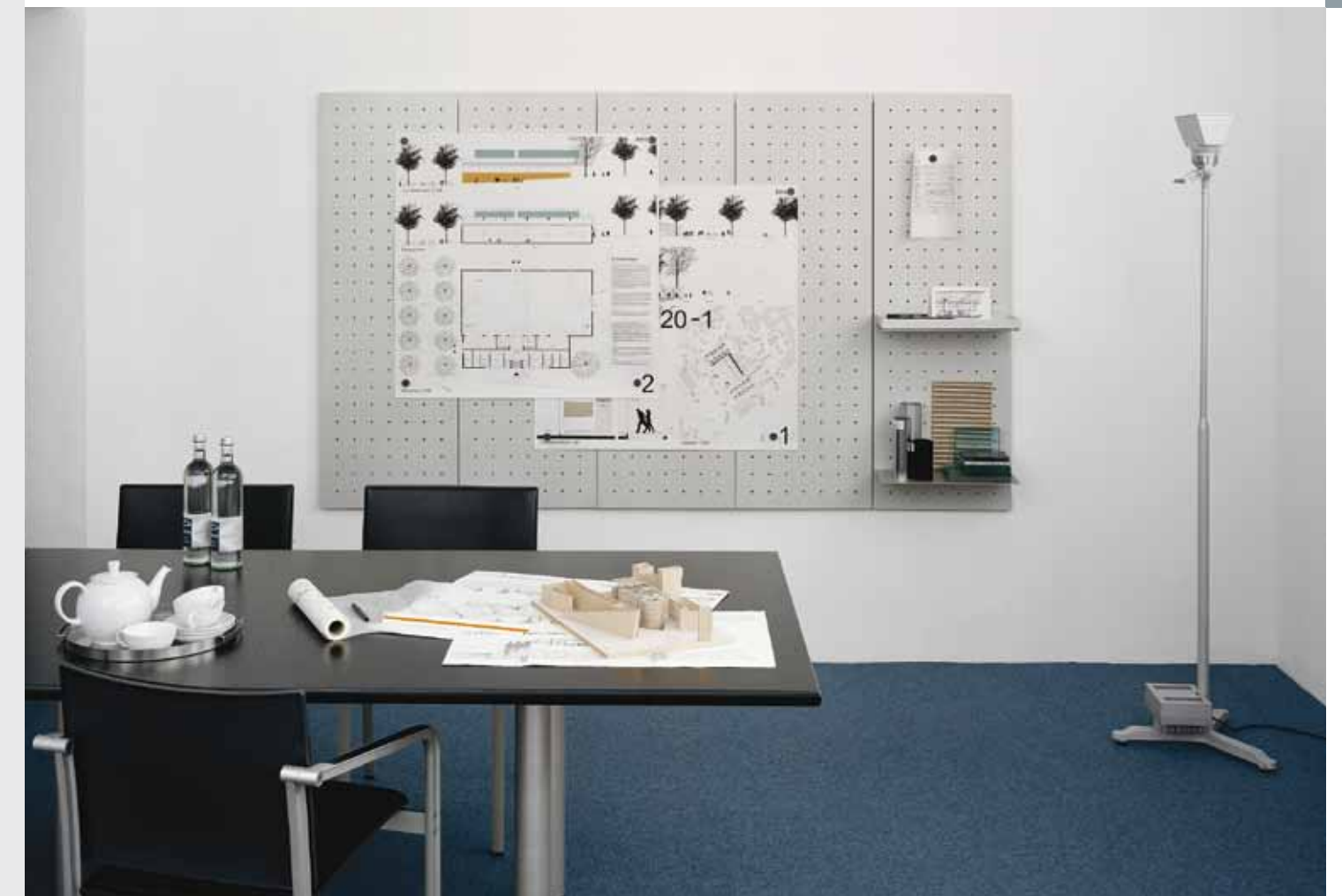
030 Paneele Lichtgrau, Ablagen Alu natur Panels light grey, shelves aluminium natural anodised